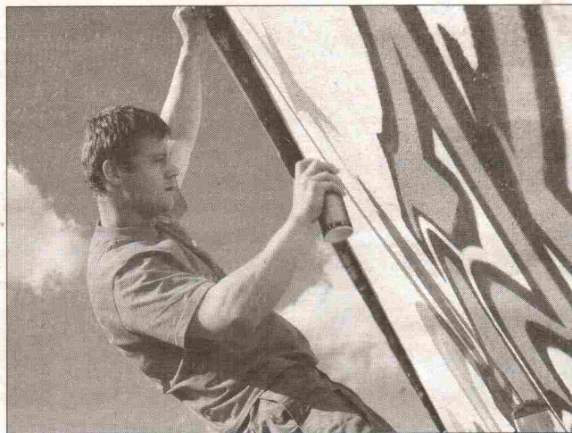
Zwischen Himmel und Erde: ein Sprüher auf der Leiter

RIGS, PSK, ALE, RTC – Kunst? Oder Schmierereien? Sprüher schreiben ihre Namen selten aus. Beliebter sind Abkürzungen, denn sie sind in kürzerer Zeit zu sprühen. Außenstehende aber