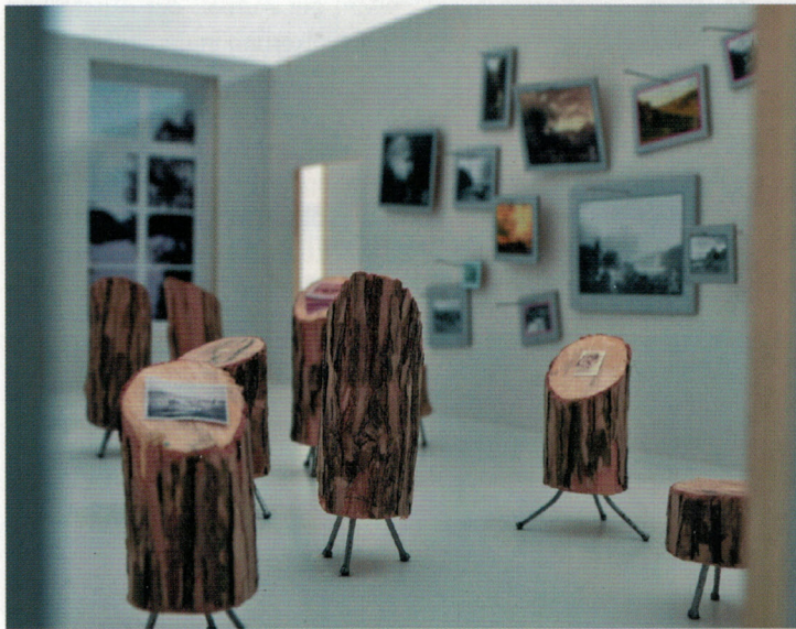
Modell der Ausstellung „Unsere Deutschen“