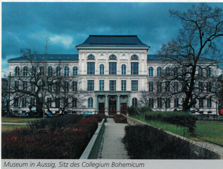
Museum in Aussig, Sitz des Collegium Bohemicum