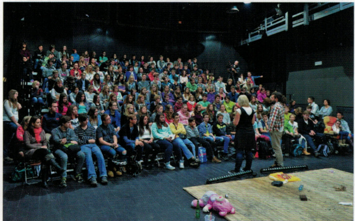
Wir Kinder vom Bahnhof Zoo

Aktuell sind die Vorbereitungen für die kommenden 19. Tschechisch-Deutschen Kulturtage im vollen Gange. Sie können sich auf interessante Veranstaltungen freuen, die im Oktober/November 2017 in Dresden, Aussig und der gesamten Euroregion Elbe/Labe gezeigt werden.