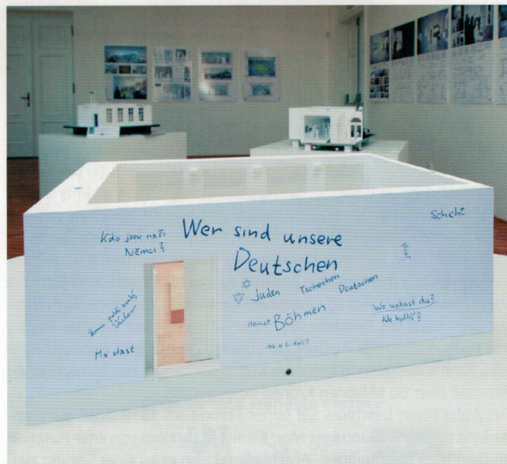
Modell der Ausstellung „Unsere Deutschen“