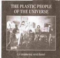
PLASTIC PEOPLE OF THE UNIVERSE na koncertu pro Mejlu vzpomínali na zesnulého lídra. Vlevo obal jejich nejlepšího alba Co znamená věstí koně.

Kabeš: Ano, v Chicagu, a dokonce jsem si s nimi zahrál.