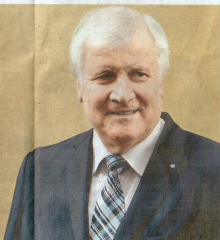
Bavorsko v Praze. Bavorský premiér Horst Seehofer (na snímku) včera otevřel v Chotkovském paláci v Praze zastoupení Bavorska v Česku. Ceremoniiu se zúčastnil i český premiér Bohuslav Sobotka.

stát kontaktním místem pro politiky a tředníky, instituce i občany obou zemí a podporovat jejich vzájemné kontakty.