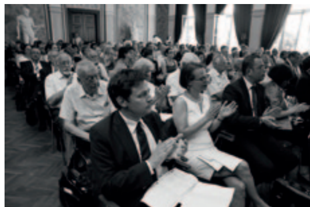
Slavnostní otevření budovy Musea – pohled do Císařského sálu.