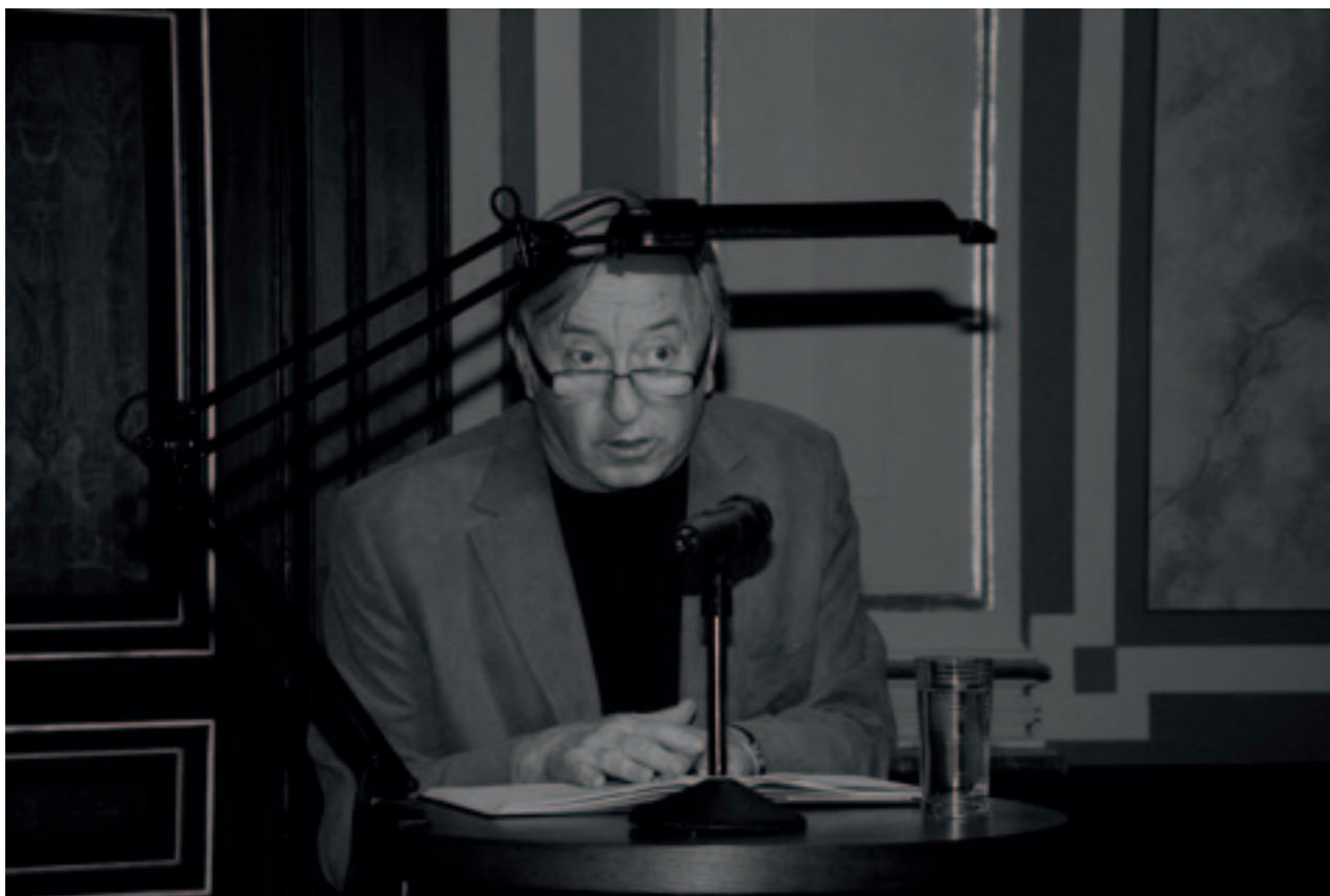
Čtení s Jiřím Lábusem. / Lesung mit Jiří Lábus.