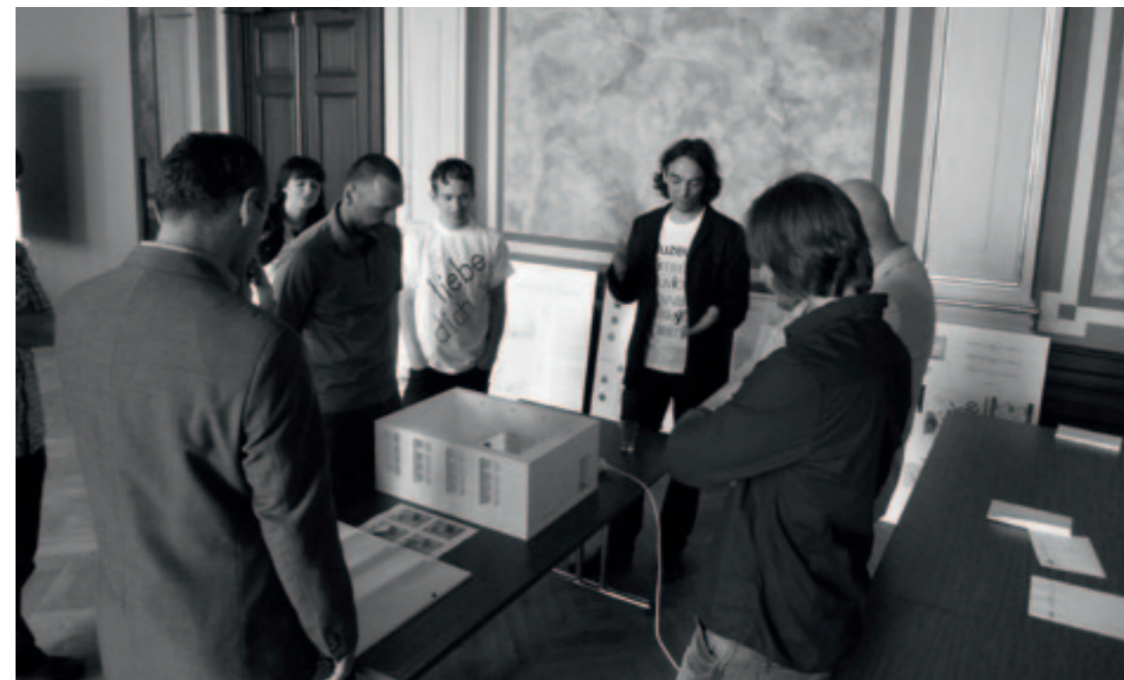
Zástupci kanceláře Projektíl architekti představují svůj návrh při zasedání poroty druhého kola architektonicko-výtvarné soutěže. /Vertreter des Architekturbüros Projektíl architekti stellen während der Zusammenkunft der Jury zur zweiten Auswahlrunde des architektonischen Wettbewerbs ihren Entwurf vor.

Die Ausarbeitung von Ideen für die Ausstellung wird durch das Programm Ziel 3 zur Unterstützung der grenzüberschreitenden Zusammenarbeit zwischen der Tschechischen Republik und dem Freistaat Sachsen 2007–2013 finanziell unterstützt.