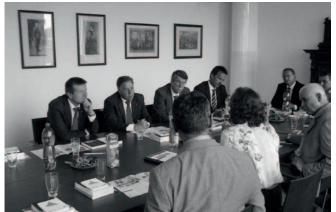
V červenci Collegium Bohemicum navštívila delegace bavorských poslanců. Fotografie z jednání se státním tajemníkem bavorského ministerstva vnitra Markusem Sackmannem (druhý zleva). / Im Juli besuchte eine Delegation bayrischer Abgeordneter das Collegium Bohemicum. Foto von den Verhandlungen mit dem Staatssekretär des bayrischen Innenministeriums Markus Sackmann (Zweiter von links).