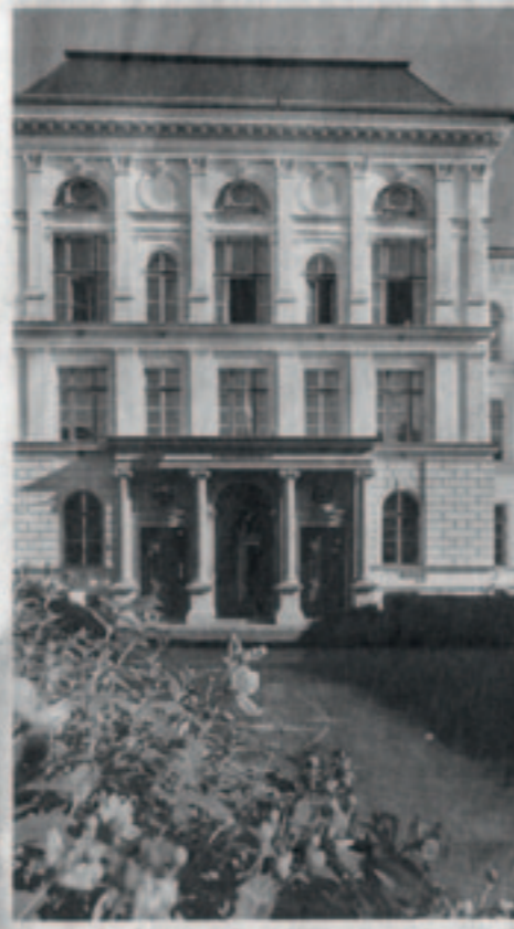
Muzeum českých Němců by se mělo rekonstruované historické budově v Ústí nad Labem náležitě otevřít za rok.

cha z ministerstva zahraničí, který je mlčenlivý a zvládnutelný představitel pověřen. „Mnoho věcí dostáváme darů," dodává.